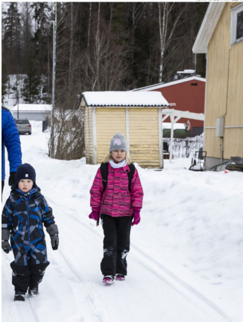
taitoivat keskiviikkona Toiviossa matkan päiväkodista ja koulusta kotiin kävellen.