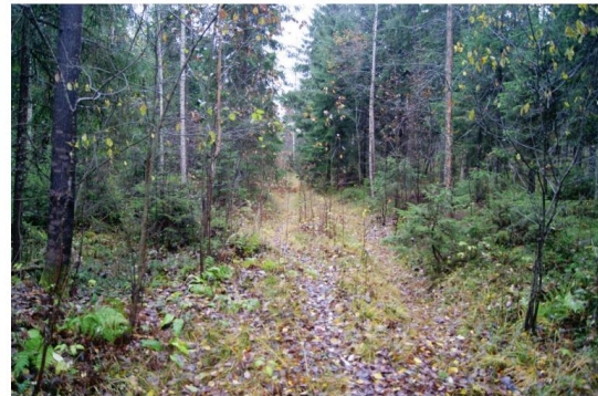
Kuva 8. Kohde 5. Vanhaa metsätietä, joka on mahdollisesti vanha kärrytie 1700-luvun lopulta asti. Kuvattu pohjoisesta.

Pirkkalan Toivion osayleiskaava-alueen arkeologisessa inventoinnissa 2015 löydetty kulttuuriperintökohde: vanha kärrytie 1700-luvun lopulta, olisi myös tärkeää huomioida viimeistään asemakaavallisessa tarkastelussa. Tiestä voitaisiin raivata ainakin pieni osa kävelytieksi ja antaa sille historiaan viittaava nimi.